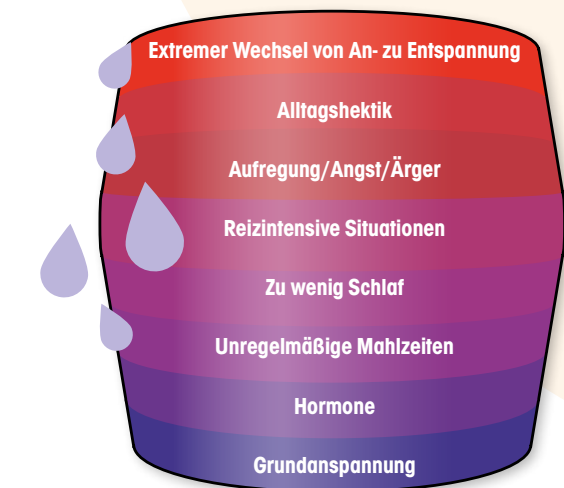
Grafik: Überschreiten der Migräneschwelle

Migränebetroffene weisen eine besondere Art der Informationsverarbeitung auf. Es handelt sich sozusagen um ein „Hochleistungs-Gehirn“, dem es schwer fällt, sich von äußeren Reizen abzuschildern und das einen hohen Energieverbrauch hat. Entsteht eine Überlastung des Systems, kann es zur Überschreitung der sog. „Migräneschwelle“ kommen.